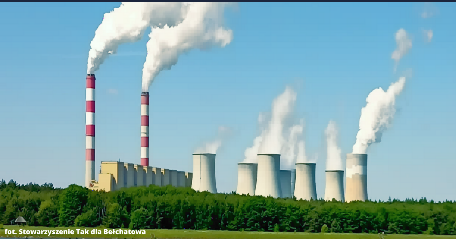
fol. Stowarzyszenie Tak dla Bełchatowa

W OKRESIE OD 1 CZERWCA 2022 R. DO 30 CZERWCA 2023 R. W POWIECIE BEŁCHATOWSKIM REALIZOWANY JEST PROJEKT: BADANIE SYTUACJI KOBIEC NA RYNKU PRACY W BEŁCHATOWIE I PROMOCJA JEGO WYNIKÓW