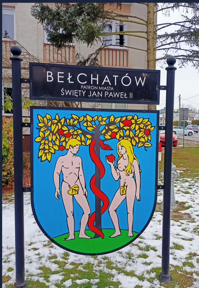
fot. Stowarzyszenie Tak dla Bełchatowa

Źródło: Kobiety na rynku pracy w powiecie bełchatowskim. Stan obecny, perspektywy, uwarunkowania. Stowarzyszenie Tak dla Bełchatowa (2023).